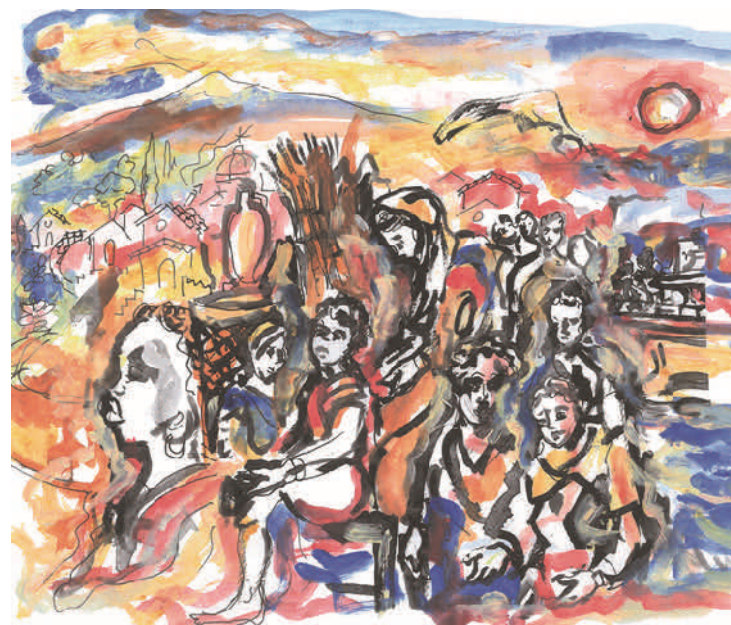
Litografia di Francesco Scialfa

I minori stranieri non accompagnati in Sicilia Una opportunità per la comunità